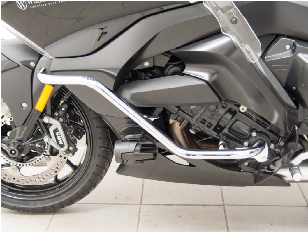
Protection Guard left