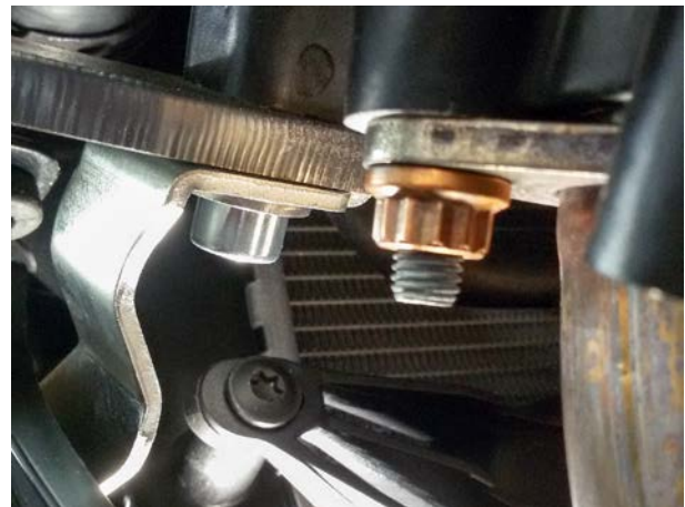
Assembly front right with additional lights