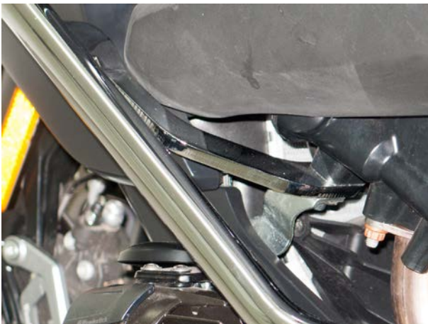
Assembly front left