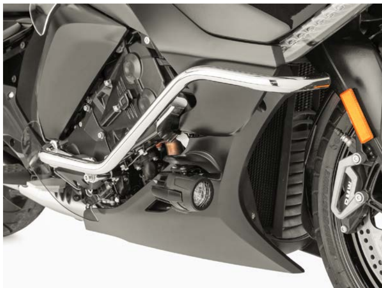
Protection Guard right

1 x Hexagon screw DIN 912 Niro 6 M x 85 mm 1 x Washer DIN 9021 M6 1 x Distance tube 13 x 2 x 45 mm