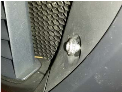
Assembly picture 1