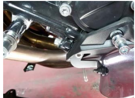
Assembly picture 3