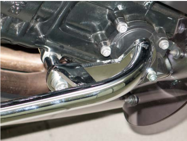
Assembly rear left