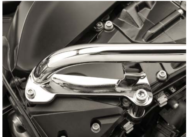
Montage hinten rechts