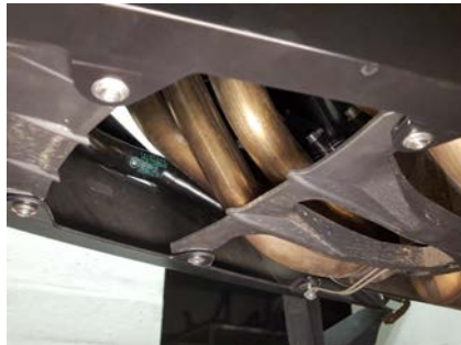
Assembly picture 2